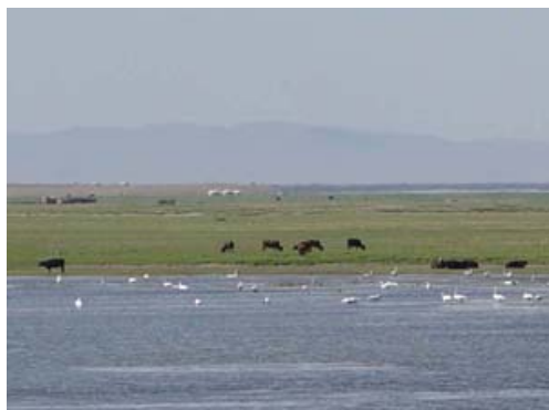
Өгий нуур, Шибүяа Тацүо.

Ашигласан материал : Anet Newsletter №3 (2002 оны 11 сар) 4 хуудас.